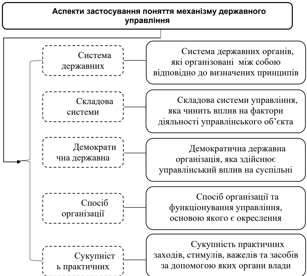
Рис. 1. Аспекти застосування поняття механізму державного управління

Щодо визначення поняття «механізм державного управління», то, проводячи аналітичні дослідження теоретико-методологічних засад формування науки державного управління, передові вітчизняні науковці вивчали його по-різному. Наприклад, Д. Дуков розглядає механізм державного управління у сукупності 10 основних аспектів їх застосування (див. Рис. 1.) [11].