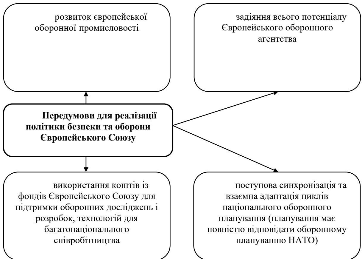
Рис. 1. Передумови для реалізації політики безпеки та оборони Європейського Союзу

Глобальна стратегія зовнішньої політики і безпеки Європейського Союзу підкреслює, що у сучасному світі однієї «м'якої» сили недостатньо, необхідно підвищити ефективність Європейського Союзу у сфері безпеки та оборони. Також, нею визначено основні пріоритети забезпечення безпеки: оборона, антитероризм, кібербезпека, енергетика та стратегічні комунікації [17]. Необхідні передумови для реалізації політики безпеки та оборони Європейського Союзу систематизовані на Рис. 1.