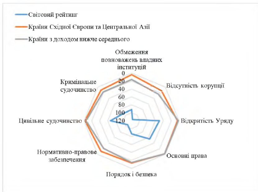
Рис. 3 – Рейтингові місця компонентів Індексу верховенства права України серед різних груп країн, 2022 р.

ключовими факторами його забезпечення у системі державного управління слід вважати демократичні принципи (відкритість суспільства, дотримання основних прав, безпека, незалежність судових інституцій) та відсутність корупції [25]. Зважаючи на виявлені закономірності, ефективне верховенство права зменшує бідність, посилює систему соціального захисту, що забезпечує фундамент для спільної справедливості, можливостей та підтримки миру, підзвітних суб'єктів владних повноважень та гарантування основних прав і свобод [1].